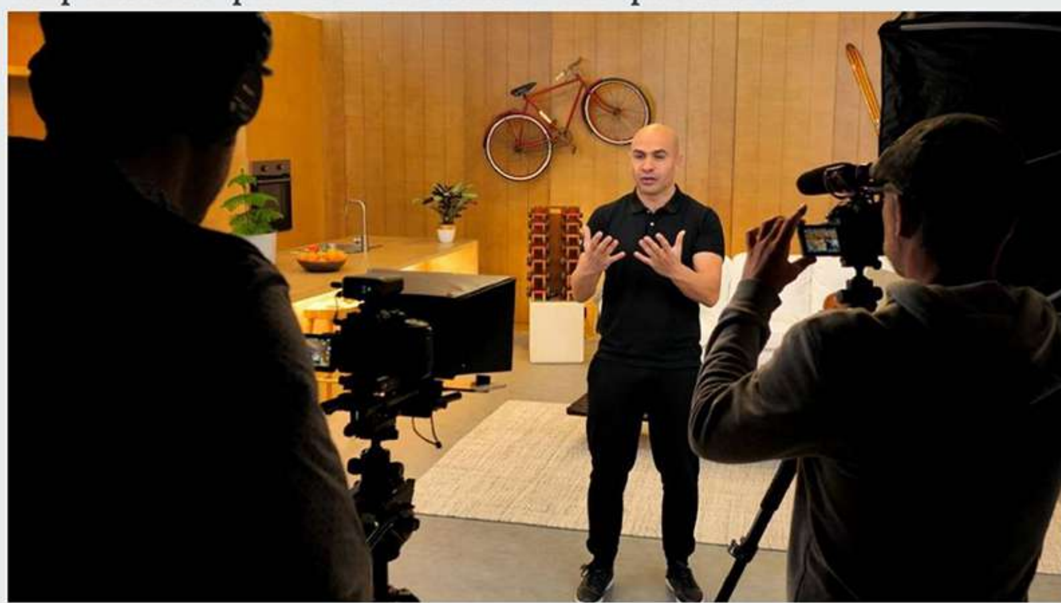
L'émission est enregistrée dans un bâtiment industriel de Saint-Cyr-en-Val, dans lequel un studio a été aménagé.