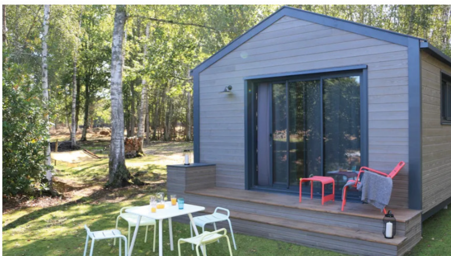
Le projet lodj - Thévenin

Dans "La Nouvelle Eco", en partenariat avec Loire&Orléans Eco, focus sur l'entreprise de BTP "Thévenin SA", à St-Cyr-en-Val qui s'apprête à commercialiser un tout nouveau produit : le "lodj", un espace de vie indépendant de 20 m 2 , projet né des réflexions post Covid-19.