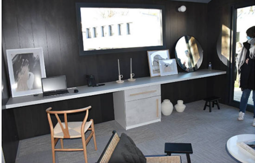
L'intérieur peut être agencé pour le télétravail.