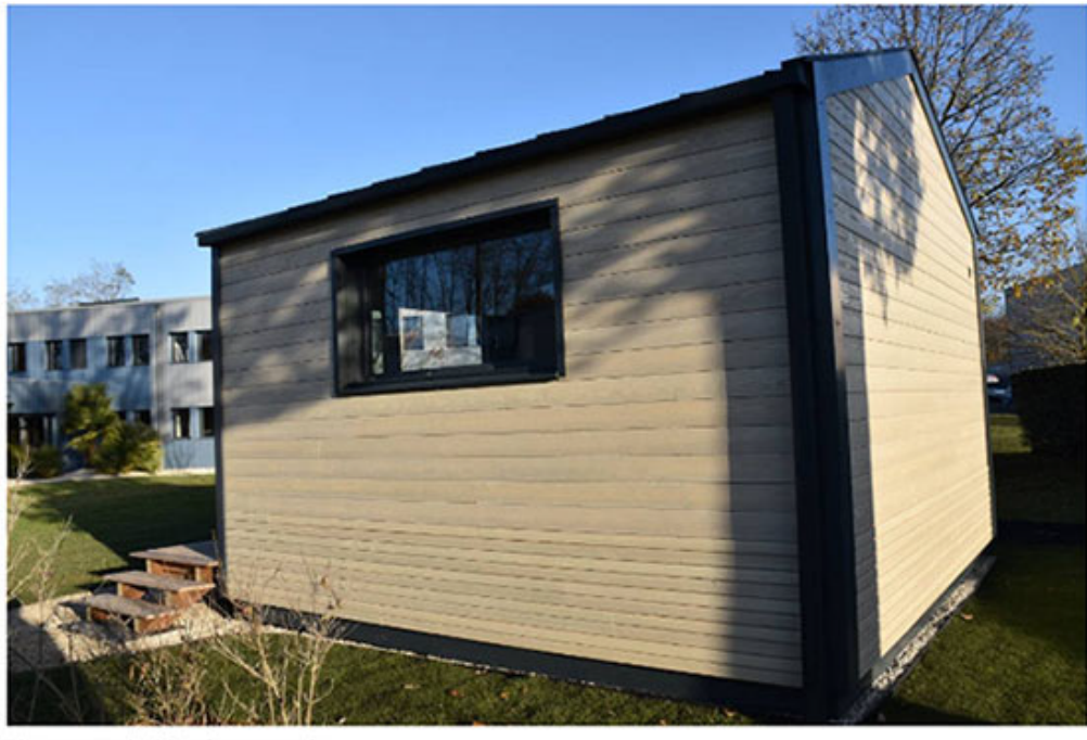
Un espace de 20 mètres carrés.

Il sera proposé en trois versions (toutes trois en démonstration sur le site du siège social, dans le parc de La Saussaye, à Saint-Cyr-en-Val) : en toit à deux pans ou toit plat, de l'Original (avec radiateur, luminaires, extracteur d'air et tableau électrique compris) à 55.000 euros, à l'Exclusif, meublé d'un lit escamotable, d'un coin cuisine, coin douche et WC indépendant, aux environs de 78.000 euros. Les prix sont plus chers de 10 % que prévu, en raison de la pénurie et du surcoût des matières premières, et notamment du bois.