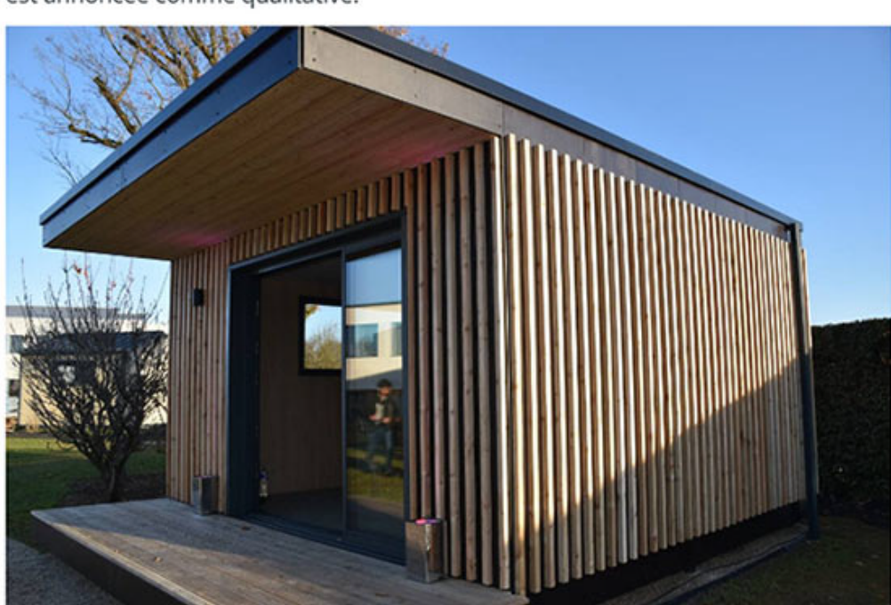
Version toit plat.

L'entreprise s'occupera des démarches administratives et des raccordements aux réseaux. Les panneaux de bois seront préfabriqués et stockés par Thévenin. L'installation sera rapide, ne nécessitant ni permis de construire, ni coulage de dalle, ni peinture. Le Lodj reposera sur des pieux de deux mètres de profondeur. L'assemblage et les finitions, par deux ouvriers de Thévenin, nécessiteront de deux à trois semaines. L'intérieur, de 4,50 sur 4,30 mètres, jusqu'à 2,80 mètres de hauteur sous plafond, sera personnalisable. L'isolation acoustique et thermique est annoncée comme qualitative.